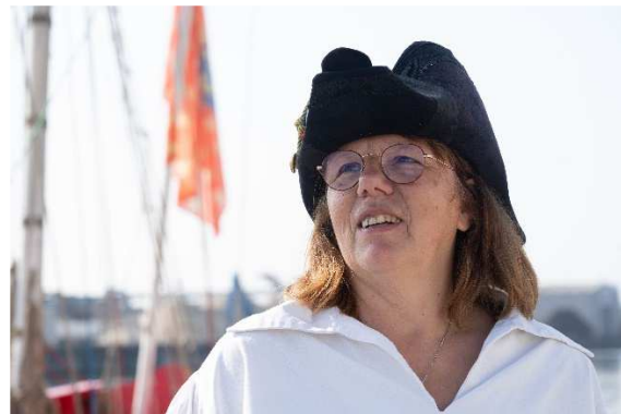
Activités culturelles : Cantus Lovaniste et participation aux Journées du Patrimoine