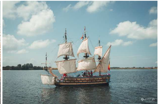
Voyage sous voiles de 'La Licorne'