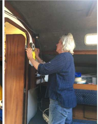
Carénage et travaux de nettoyage au Javelot