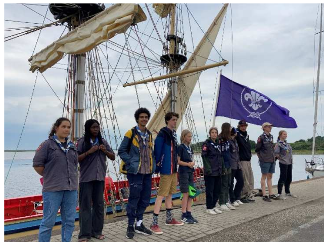
Camps Scouts 'Roodbaard' et 'Carolus Quinto' à Brouwershaven