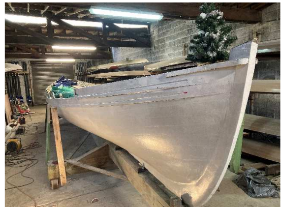
Travaux de rénovation lourde de la Yole 'Val Maubée', rebaptisée 'Résilience' dans l'Atelier du Pôle Nautique Solidaire