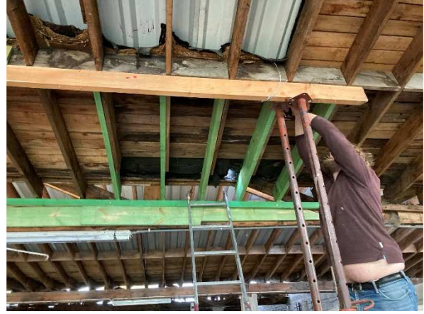
Travaux d'aménagement au SNUB – Pôle Nautique Solidaire