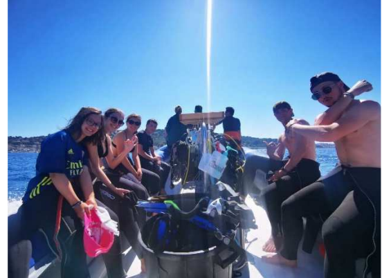
Camp d'été Solidaire à Toulon