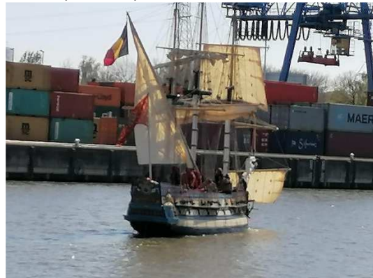
Premiers tests sous voiles sur le Canal