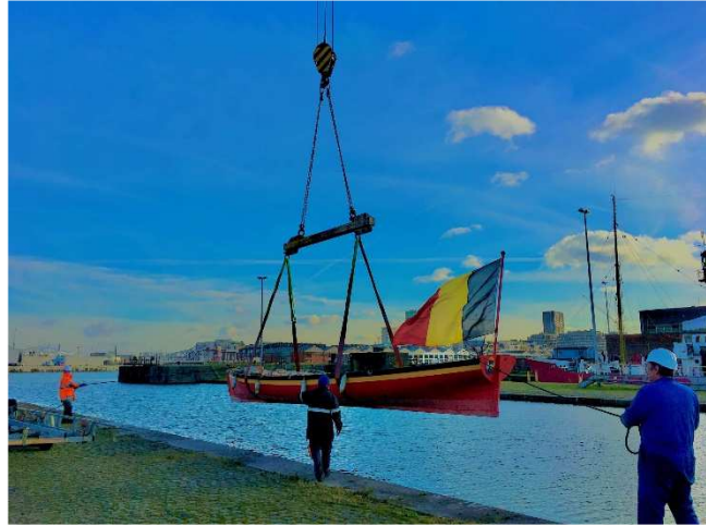
Visite de la 'Belgica' et mise à disposition d'Uilenspiegel à Anvers