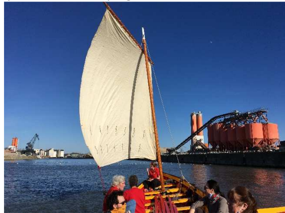
Reprise des activités en yole par tous temps, masqués ou non...